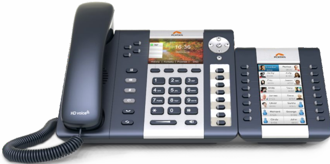
Konsola Platan EXT-244CG z telefonem Platan IP-T216CG