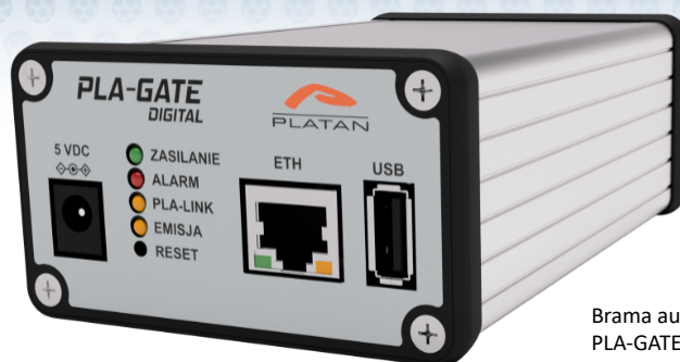
Brama audio IP PLA-GATE DIGITAL