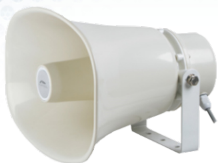
Głośnik tubowy IP PLA-30PH-IP

Aktywny głośnik tubowy PLA-30PH-IP jest przeznaczony do obiektów przemysłowych i biurowych. Duża moc, dobre pasmo przenoszenia i doskonała jakość dźwięku pozwalają na przekazywanie komunikatów głosowych i muzyczno-dźwiękowych. Są one dobrze słyszalne i zrozumiałe zarówno w pomieszczeniach, jak i na zewnątrz.