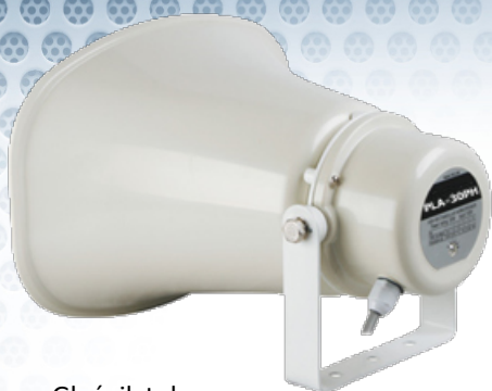
Głośnik tubowy PLA-30PH