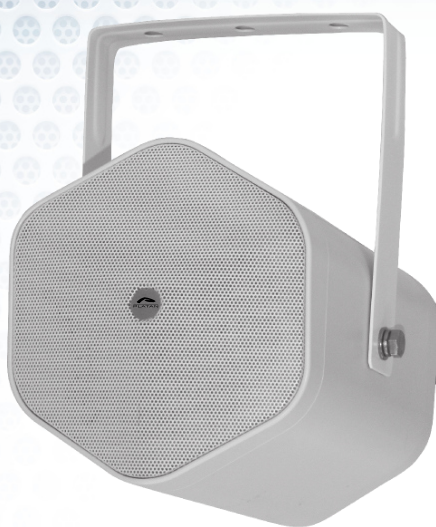
Głośnik projektorowy PLA-15P

Głośniki są ostatnim ogniwem megafonowej sieci rozgłoszeniowej . Pracują w systemach zgodnych z wytycznymi IPI-6 firmy PKP PLK, jako nagłośnienie stosowane z lokalnym serwerem zapowiedzi lub samodzielnie. Głośniki firmy PLATAN charakteryzują się: